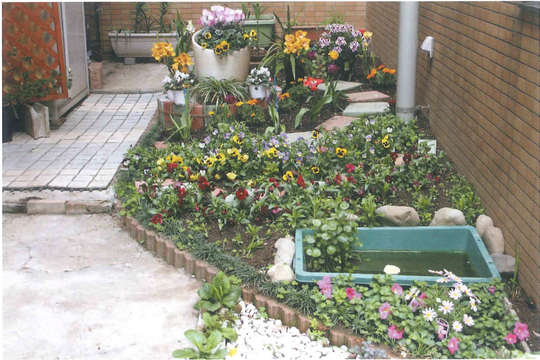
「シルバーピア本館南側出入口脇の花壇」