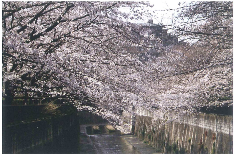
石神井川沿いの桜