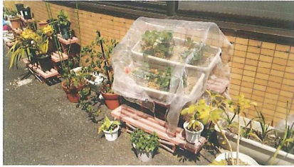
温室栽培のいちご